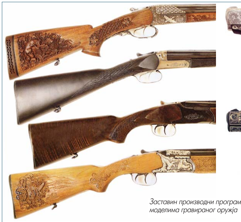
Заставин производни програм моделима гравираног оружја

– Ми можемо да замислимо да у нашој фабрици радимо неки други производ, али нам је за то потребна сасвим друга опрема. А то повлачи нове инвестиције, нове раднике и инжењере који неће замишљати производ са цевком. А сви смо ми, без обзира на завршену школу, балистичари, оружари. И само то знамо. Ми не можемо да урадимо конверзију. То може неко други. Али ће морати да направи другу линију и да запосли друге раднике, а онда му овај погон неће требати. То ће бити нова фабрика, поред ове наше, али никако конверзија производње. Ми једино можемо да повећамо проценат успелних капацитета у цивилном програму – за спортско и ловачко оружје.