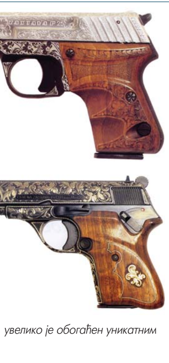
увелико је обогаћен уникатним