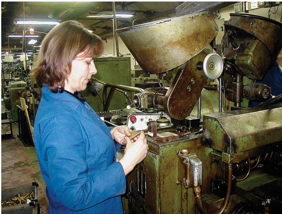
“Први партизан” је у самом врху светских произвођача муниције по броју калибра које може да понуди